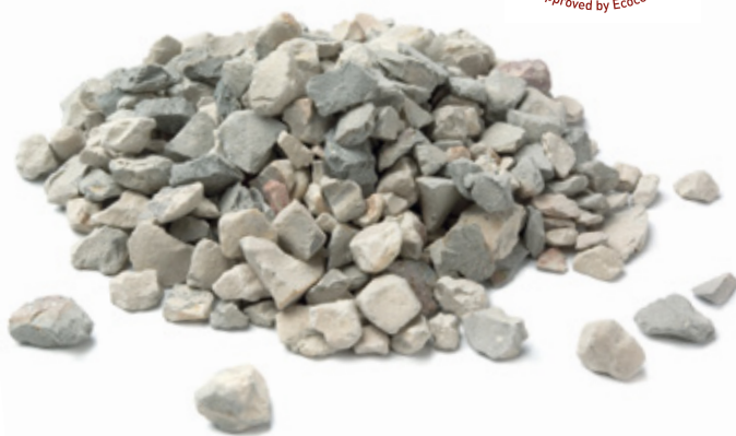
Bed med Resorb+ ™